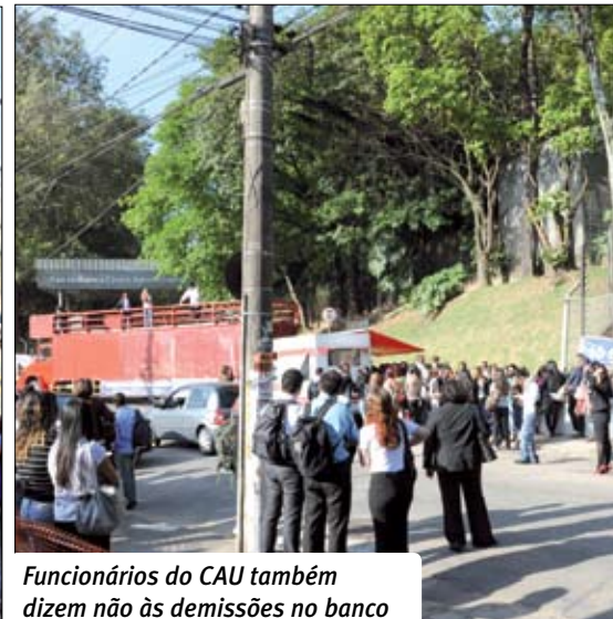
Funcionários do CAU também dizem não às demissões no banco