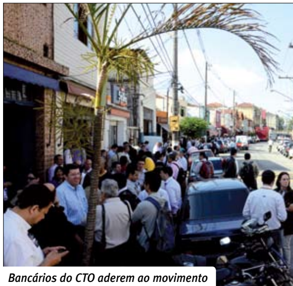
Bancários do CTO aderem ao movimento