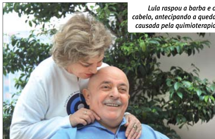
Lula raspou a barba e o cabelo, antecipando a queda causada pela quimioterapia

Juvandia lembra que Lula foi responsável pela guinada que colocou o Brasil entre os países mais importantes do mundo. “Foi o trabalho do governo Lula que tirou da miséria milhões de brasileiros, com políticas como o bolsa família e a do salário mínimo negociada com o movimento sindical, estabilizou a economia nacional, gerou empregos e alterou a lógica de país subserviente aos interesses internacionais, colocando o Brasil no protagonismo da economia mundial. Só por isso, Lula mereceria o respeito de todos. Mas merece mais, como cidadão brasileiro exemplar, que passou por todas essas dificuldades e venceu, com honra e dignidade.”