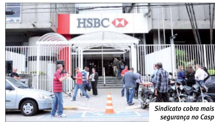
Sindicato cobra mais segurança no Casp